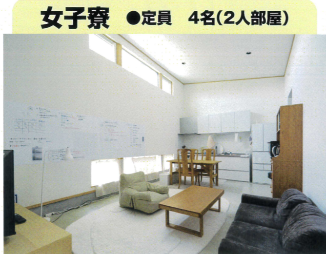
女子寮 ●定員 4名(2人部屋)