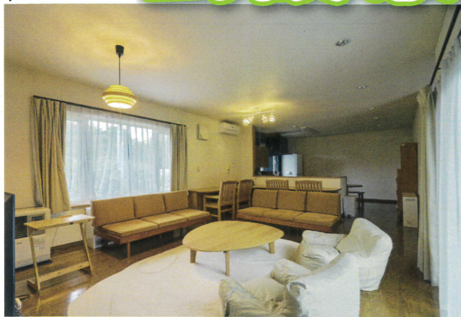
男子寮 ●定員 6名(2人部屋)